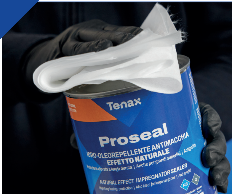
Inumidire il panno