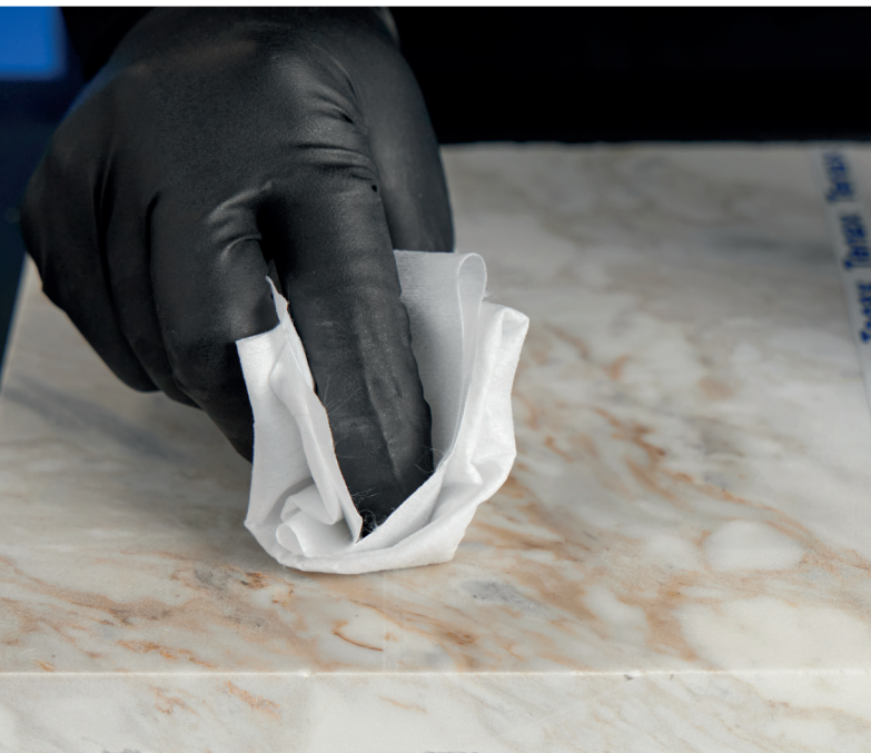
Applicazione del prodotto